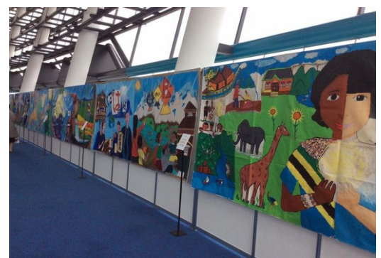
アートマイル：本校制作の壁画

本校では、ユネスコスクール加盟(平成26年9月)以前から、ESD(持続可能な開発のための教育)に取り組んできた。地球的規模の課題を扱うESDは、本校の教育全般(教科、総合学習、特別活動等)で取り組んでいるが、社会科等の合科的実践として3年「ESD」、4年「国際理解」(学校設定科目)を設けて特設的に実践している。また、アートマイル(壁画制作を通しての国際交流)や「食」プロジェクト等を実践している。