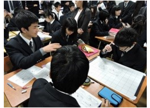
話し合い考える「地歴」学習

「地理基礎」は、地誌・系統地理・主題学習を関連づけた「主題的相互展開学習」として構成している。また「歴史基礎」は、日本史と世界史を融合し近現代史を重視した「主題的単元史学習」として構成している。中教審や学術会議の審議にも影響を及ぼしており、マスコミ等からも注目されている。今後、新学習指導要領の策定を見通し公立学校への効率的な普及に尽力する予定である。