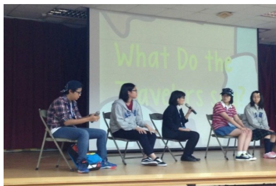
世界の文化：台湾高雄師範大附属との協同発表