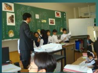
私のこころに残ったことは！