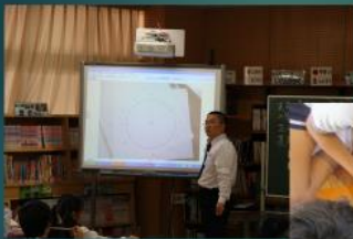
タブレットを使った体育の授業