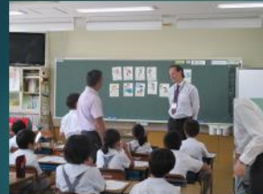
英語を使ってコミュニケーション