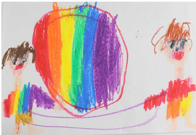
ボールで遊んだ絵 小学部 3 年