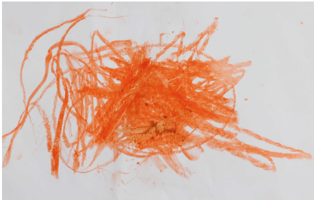
小学部運動場の絵 小学部 6 年