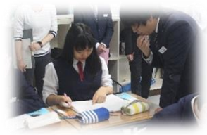
中1数学での少人数指導に力を入れています。

子供たちの確かな力を育む、先進的な研究に取り組み、公立校に情報提供しています。今年度より「主体的・対話的で、深い学び」いわゆるアクティブ・ラーニングによる授業の研究を進め、実施しています。