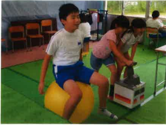
【あおい学級での交流】