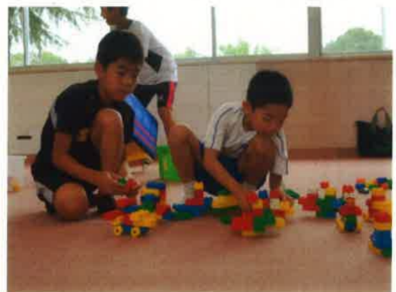
【すみれ学級での交流】