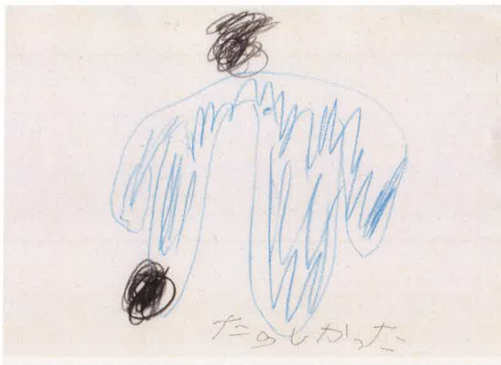
2回目の交流のとき、一緒にサッカーをした場面を書きました。

提出日 平成28年3月15日(火) 学校名 愛知教育大学附属特別支援学校 学年 小学5年男子