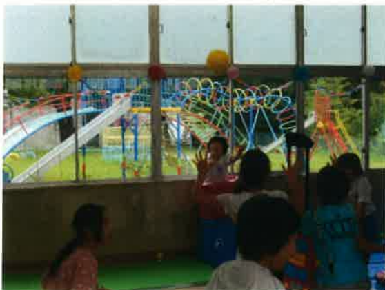
【さくら学級での交流】