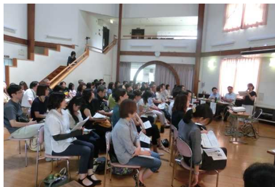
多くの保護者が参加