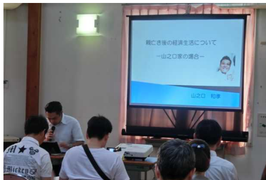
「親亡き後の経済生活について」