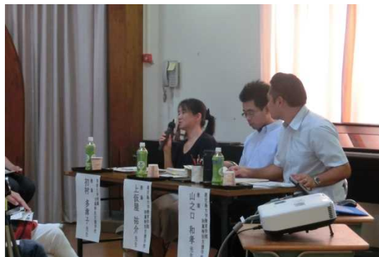
3人の講師が丁寧に応答しました