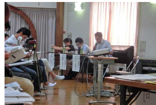
ビデオカメラを持参する保護者の姿も