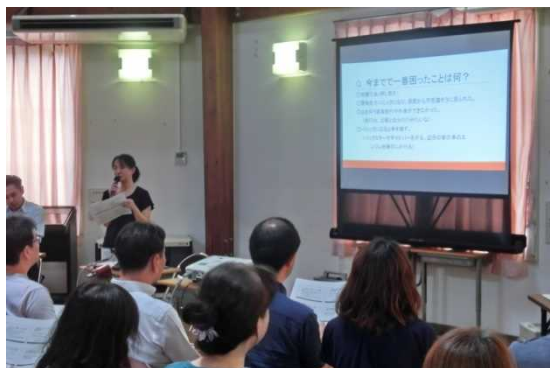
「障害のある兄との関わり」