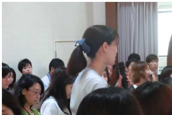
質疑応答の時間は足りないくらい