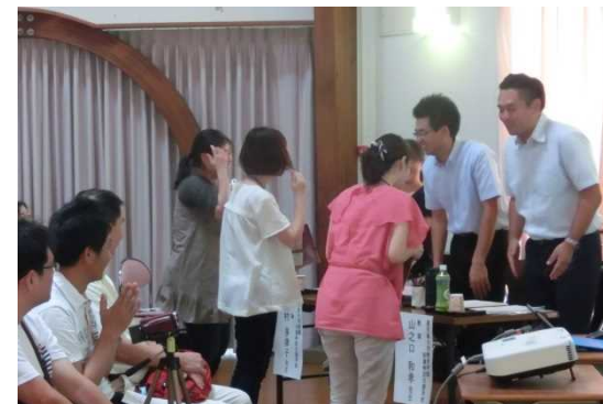
講師の先生方の気持ちに感謝