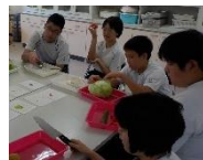
主体的・対話的で 深い学びの実現