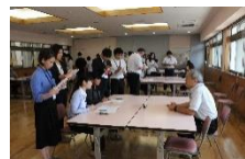
ジョブコーチセミナー