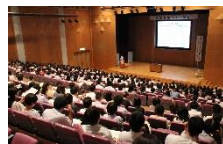
進路支援フォーラム