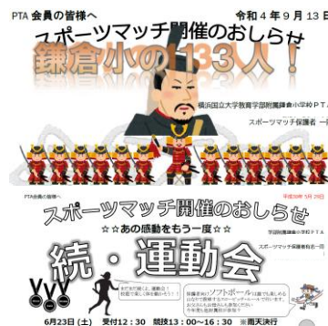
開催案内は子供の興味を引くデザインに