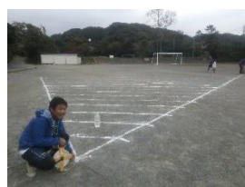
オリンピックの年にはオリン ピック競技を模した内容も！