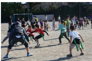
2019年ラグビーW杯の年はタグラグビーを開催 子どもだけでなく大人も楽しみました

遊びはアイデアの宝庫です。どうやってチームをまとめ・楽しみ・勝つか。私たちが小学生のころのような、あるもので工夫して遊びを考えることがなかなか出来なくなってきた昨今、学校生活以外の場で、決められたルールの中で自由な発想とリーダーシップを発揮できる上級生、そんな上級生の背中を追いかける下級生の成長と共に、親子の絆が深まることを期待しています。