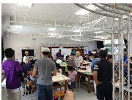
図工室ではペットボトルを工夫して作る姿も 大人も子供も最大飛距離を出すために真剣です